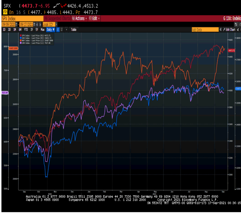
Grafik 1 : Bloomberg karşılaştırmalı endeks değişimleri:

S&P 500 %-0,155 DAX %0,23 FTSE 100 %0,16 NIKKEI 225 %0,50